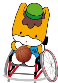
群馬県のマスコット 「ぐんまちゃん」